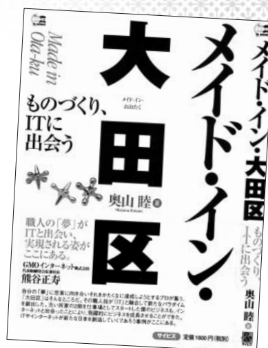
『メイド・イン・大田区 ものづくり、ITに会う』 2005年に出版した「大田区の今を描く本」の第1弾

「融資担当窓口の方は、私が必死に作成した事業計画書や決算書に丁寧に目を通してくれ、次に私に向かってこう言いました。『これなら事業を続けても大丈夫ですよ』と。