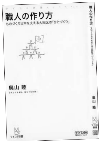
『職人の作り方 ものづくり日本を支える大田区の「ひとづくり」』 ものづくり企業の「ひとづくり」に スポットを当てた1冊

が、日本の場合は失業期間が1年以上というのもザラで、こんなことばかり続いたら誰だって働く気なんてなくなってしまいます。最近では新卒の定義を25歳まで伸ばそうということが盛んに言われだしましたが、もう大賛成ですね」